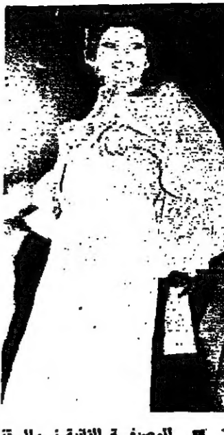
الوصيفة الثانية نوال تصدح ، غناء ابو الخلف ملكة جمال لبنان العربية